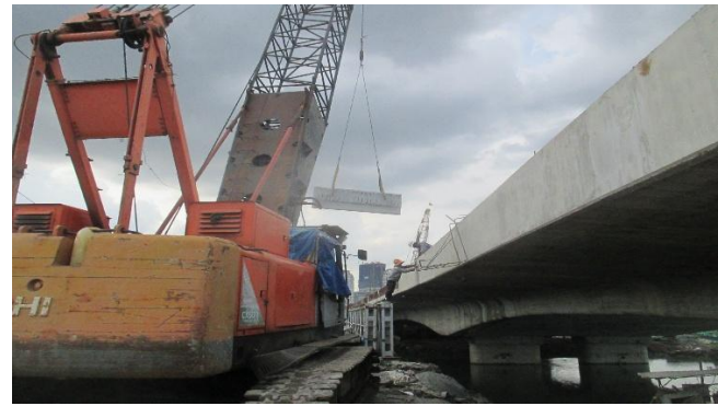
Công trường xây dựng cầu Cá Trê