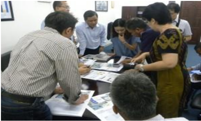
Hình ảnh buổi làm việc giữa CII và Ciputra

Ciputra là tập đoàn hàng đầu thế giới về phát triển đô thị mới. Với mạng lưới hơn 100 công ty thành viên, tập đoàn Ciputra đi tiên phong trong lĩnh vực phát triển bất động sản với quy mô lớn, tạo nên những cộng đồng đô thị xanh sạch và hiện đại. Đến nay tập đoàn Ciputra đã đầu tư và phát triển hơn 20 khu đô thị tại 18 thành phố của Indonesia với diện tích từ 500 ha đến 6.000 ha. Bên cạnh đó, tập đoàn Ciputra cũng đã đầu tư vào Việt Nam qua dự án Khu đô thị mới Nam Thăng Long ở Hà Nội (Ciputra Hanoi International City).