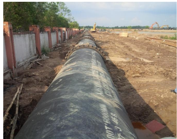
Dự án hệ thống truyền tải nước Củ Chi