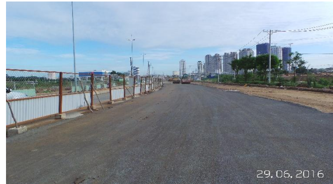
Hiện trạng đường trục Bắc Nam